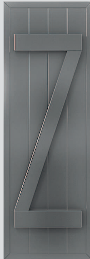
ABL-Z mit 2 Gradleisten und Z-Profil