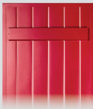
Isoladen-G* in Bretterladenoptik mit 2 Gradleisten