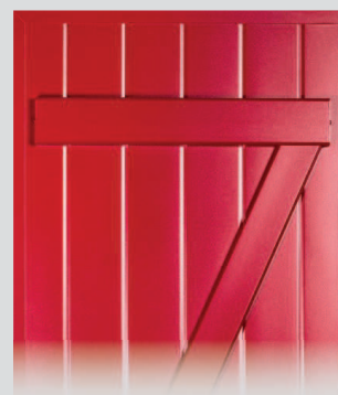
Isoladen-Z* mit 2 Gradleisten und Z-Profil

* Hinweis zum Bimetall-Effekt bei Isoläden