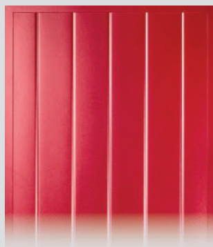
Isoladen* in Bretterladenoptik

Auch mit Füllung aus isolierender Sandwichplatte erhältlich