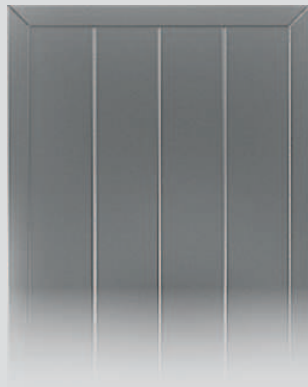
ABL in Bretterladenoptik