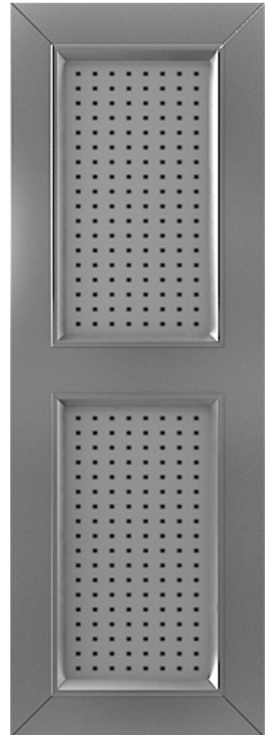
Abb. zeigt Typ AB 100 mit Querfries (Mehrpreis)