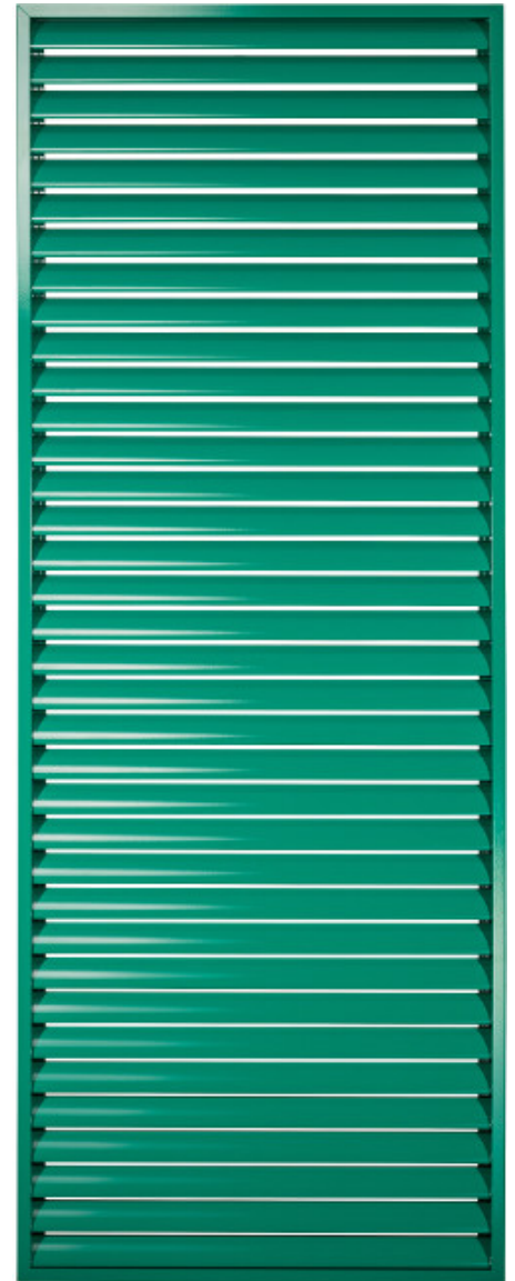
Abb. zeigt Typ SL 1000 S

Zur Verwendung der WIEKU-Schiebeläden unter Einwirkung besonderer Umwelteinflüsse wie z.B. Seeklima (Entfernung zur Küste < 50km), Einwirkung durch Streusalz oder durch Industrieanlagen empfehlen wir eine spezielle Beschichtung der WIEKU-Produkte. Ansonsten erfolgt die Lieferung ohne Gewährleistung!!!